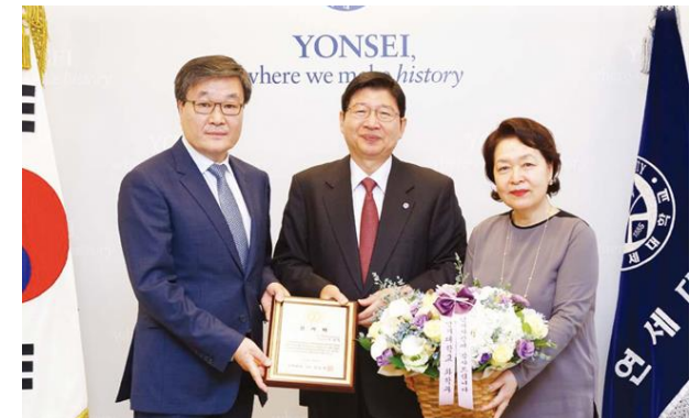
연세대 장학기금 전달