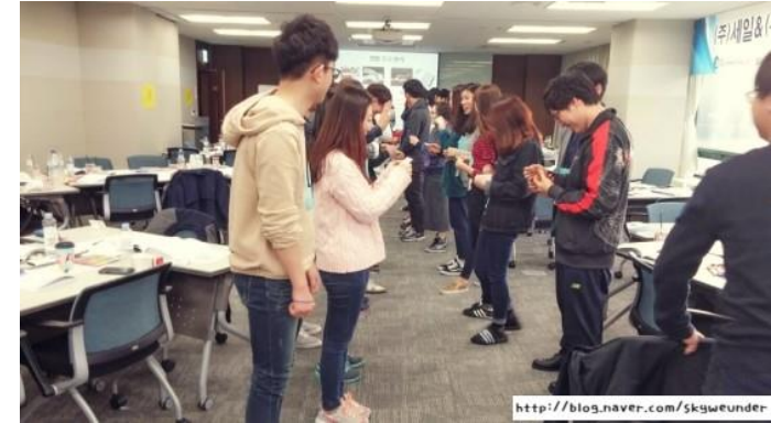
팀원 역량 강화 프로그램중